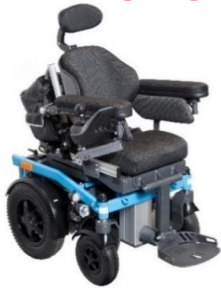
⊗ Elektrorollstuhl Swiss Viva Junior